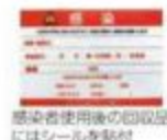
感染者使用後の回収品にはシールを貼付